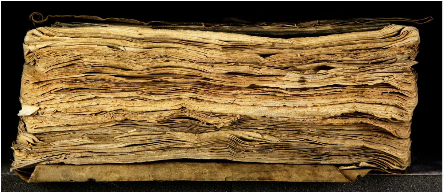
Early European Books, Copyright © 2009 ProQuest LLC. Images reproduced by courtesy of the Royal Library, Copenhagen. LN 588 8°